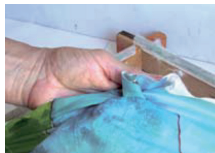
La cire étant refroidie, détachez puis froissez la soie. Les craquelures apparaissent