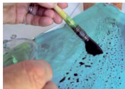
Repassez du colorant sur les craquelures ainsi formées